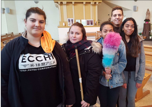
Le chiffon, le balai, le plumeau... et la bonne humeur !

de tous. Il faut aider le petit groupe des bénévoles qui, dans le silence, réalisent cette tâche régulièrement dans les deux églises. »