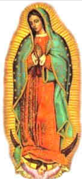
En décembre 1531, la Vierge de Guadalupe apparaît à un Aztèque, Juan-Diego Cuauhtlatoatzin.

Intention de prière du Saint-Père, en décembre 2017